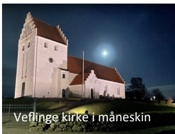
Veflinge kirke i måneskin