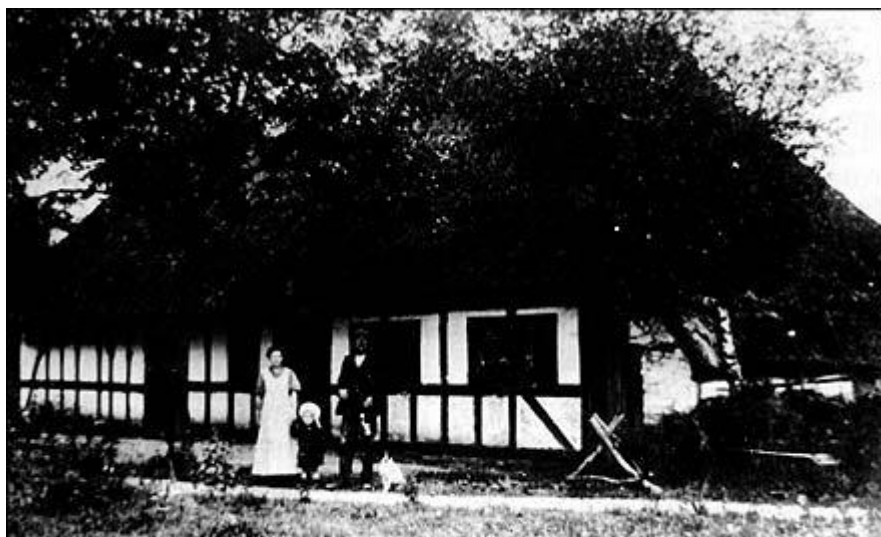
Ane Maries Stiftelse. Genopført efter brand i 1869.

Som kongelig lensmand varetog han også styrelsen af Rugaard, Odensegaard og Dalum Kloster. Axel Brahesvej i Veflinge er opkaldt efter ham.