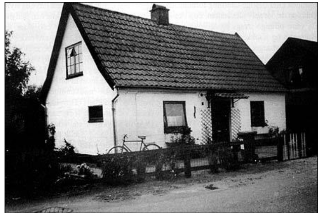
Trefoldigheds hospital - nu i privateje.